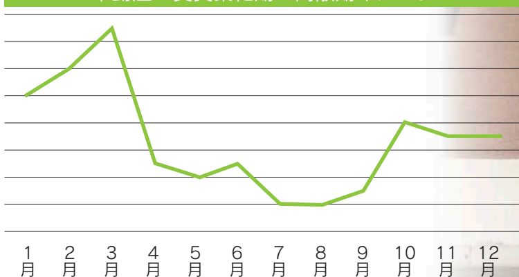
不動産 賃貸繁忙期・閑散期イメージ

弊社では、時期を問わず丁寧な接客を心掛けてご案内しております。お部屋探しをご検討中の方がいらっしゃいましたら、是非ご紹介お願い致します。