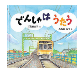
でんしゃはうたう