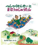
つんつくせんせいとまほうのじゅうたん